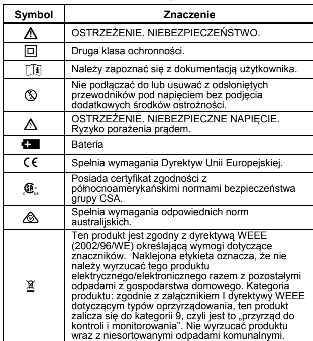
Tabela 1. Symbole